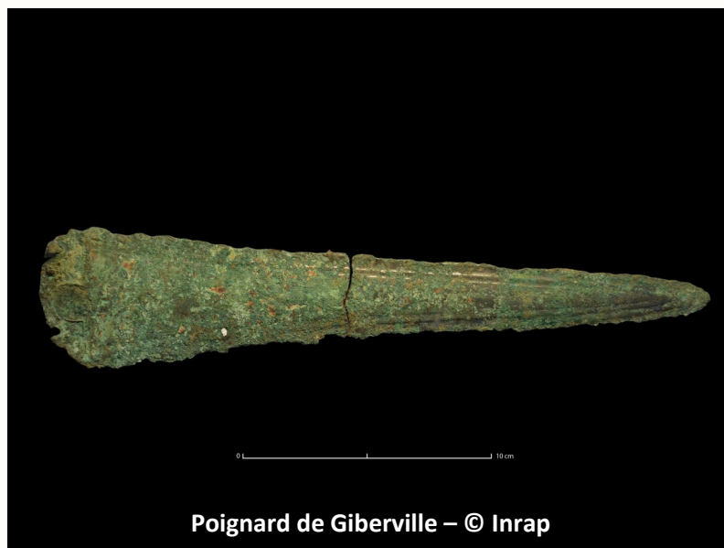
Poignard de Giberville

conférence va nous permettre de mettre en perspective ce nouveau monde, examinant la société du Bronze ancien dans l'ensemble de ces dimensions ; un focus sur les fouilles récentes autour de Caen (Normandie) ouvriront sur une lecture des territoires.